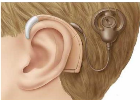
Figura 1: Implante Coclear