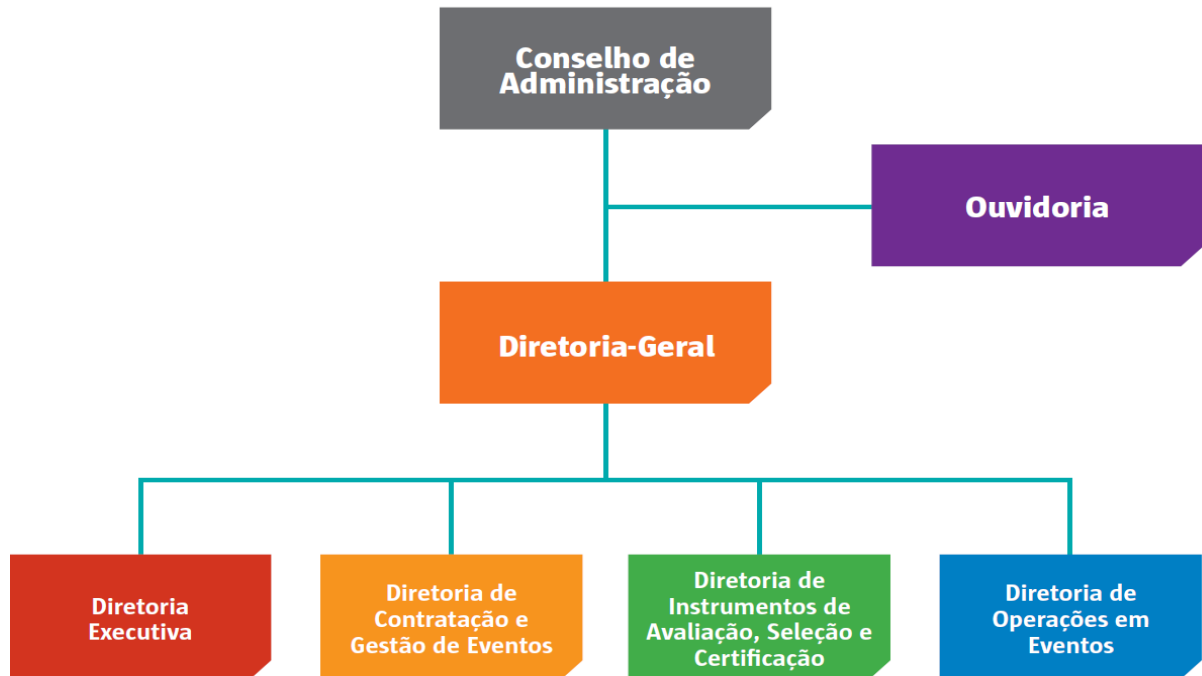
Figura 3 – Organograma da Alta Administração na Nova Estrutura Organizacional.