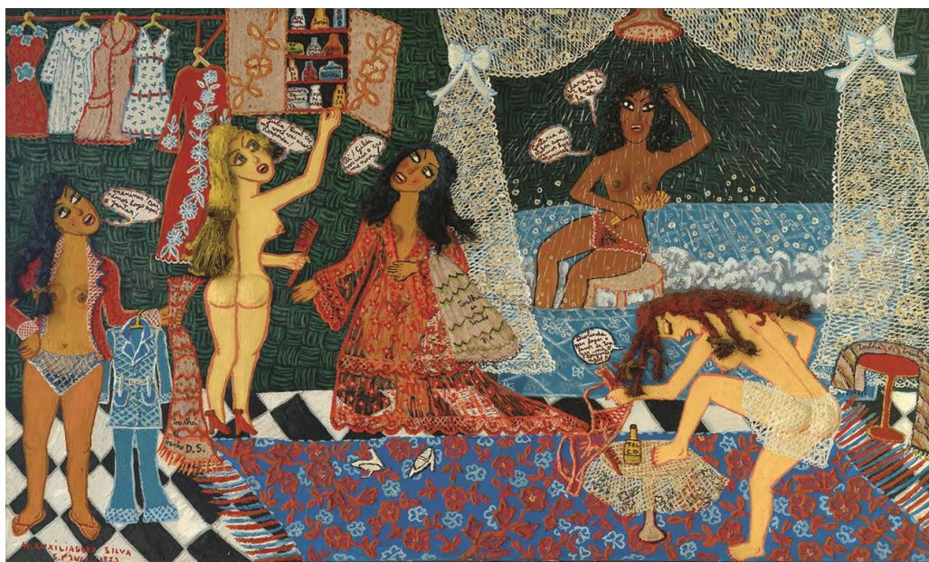
Maria Auxiliadora, "A preparação das meninas", técnica mista, 60 X 100 cm, 1972.

Nessa tela, cinco mulheres conversam em um grande banheiro. Uma delas toma banho sentada em uma banheira, cercada por uma cortina toda bordada com a massa Wanda. Percebe-se esse mesmo relevo no tapete que cobre boa parte do chão quadriculado em preto e branco, nas peças de roupa e em uma pequena mesa em que uma das mulheres se apoia no canto inferior direito da imagem. Auxiliadora também faz aplicação de cabelo em todas as figuras, principalmente nas figuras femininas negras, reafirmando a identidade dos corpos negros com o cabelo crespo.