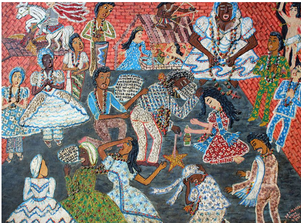
Maria Auxiliadora. "Candomblé". Década de 70.

No canto superior esquerdo temos a imagem, provavelmente em cima de uma estante, de São Jorge e seu cavalo, Santo católico sincretizado com o Orixá Ogum, Senhor da guerra e do ferro. A frente da imagem do Santo, temos a famosa Curimba, que é formada por um grupo de homens, denominados Ogan, responsáveis pelas músicas no momento da gira para os Orixás, ponto importante em muitas religiões afro-brasileiras.