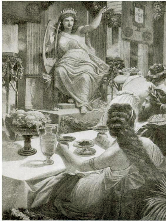
Figura 1: O banquete no palácio de Tétis com Vasco da Gama.