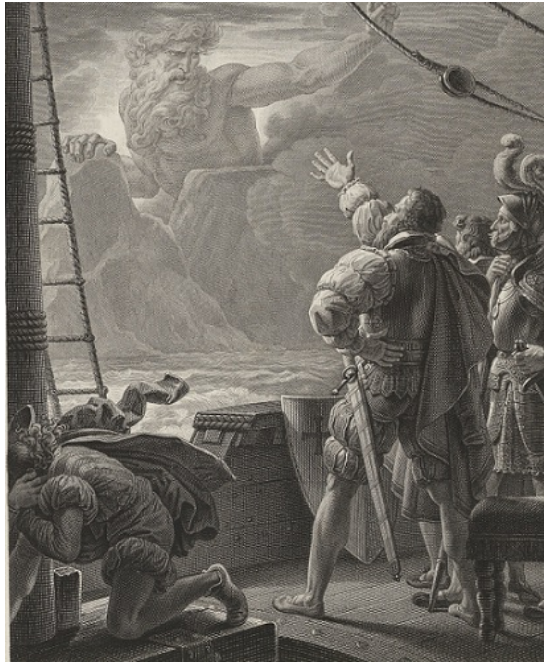
Figura 8: Vasco da Gama perante Adamastor. (Disponível em: https://www.cnc.pt/os-lusiadas-de-luis-de-camoes/ )