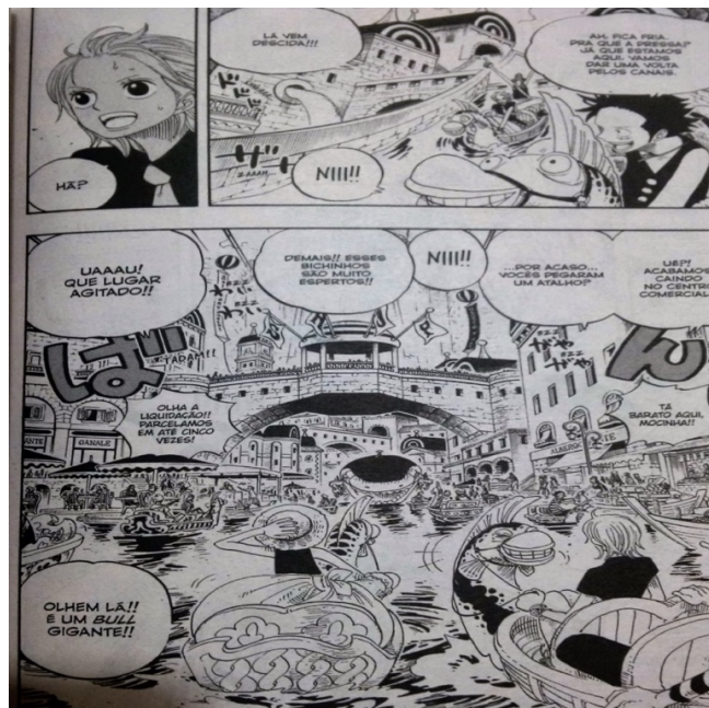
Figura 5: Luffy em Water Seven (Idem)

Na epopeia de Camões, a parte em que os portugueses chegam à Ilha dos Amores é outro excelente exemplo da capacidade do autor de provocar a curiosidade e