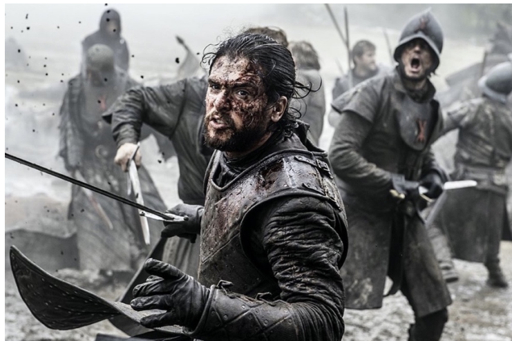
Figura 3: Cena de guerra na série de TV Game of Thrones . (Home Box Office. Disponível em https://veja.abril.com.br/cultura/saiba-o-que-ha-de-historia-real-em-game-of-thrones/ )

Já fica vencedor o Lusitano, Recolhendo os troféus e presa rica; Desbaratado e roto o Mauro Hispano, Três dias o grão Rei no campo fica. Aqui pinta no branco escudo ufano, Que agora esta vitória certifica, Cinco escudos azuis esclarecidos, Em sinal destes cinco Reis vencidos. (CAMÕES, III, 50-53, 2010, p.113-114)