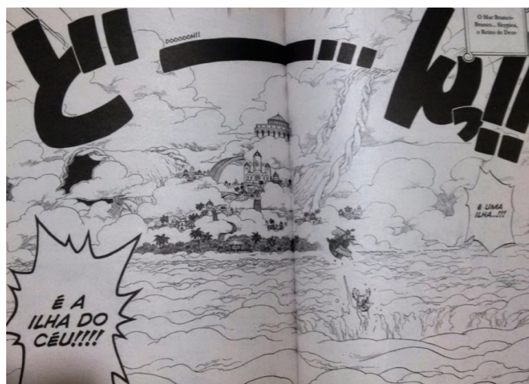
Figura 6: Luffy chega à Ilha do Céu (Ibidem)

Em comparação, há um momento de grande deslumbre no mangá One Piece , quando os navegantes chegam a uma ilha no céu: