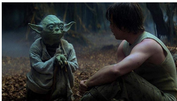
Figura 7: Mestre Yoda treina Luke, em O Império Contra-Ataca .