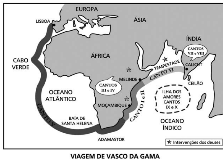
Figura 2: A viagem de Vasco da Gama e Os Lusíadas .