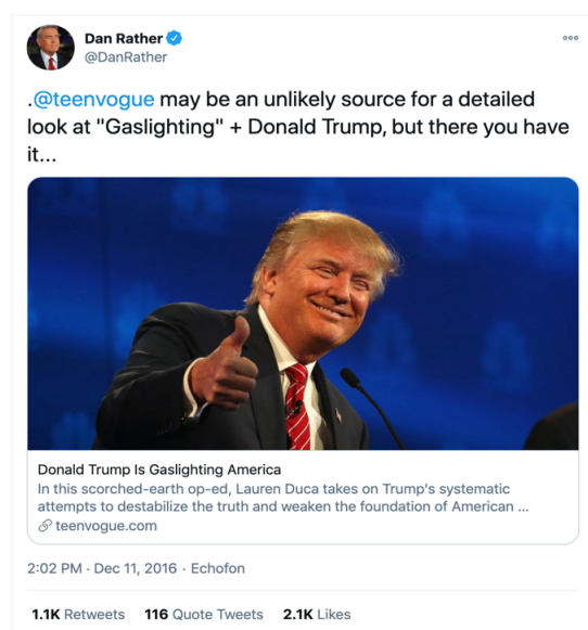
Figura 1. Printscreen do tweet do jornalista Dan Rather referenciando o artigo "Donald Trump está manipulando a América"

Fonte: Twitter. Disponível em https://mobile.twitter.com/danrather/status/807978939851403264 Acesso em 10 de dezembro de 2020. Tradução da autora: “@teenvogue pode ser uma fonte inusitada para uma reportagem detalhada sobre "manipulação" + Donald Trump, mas olhe só...”