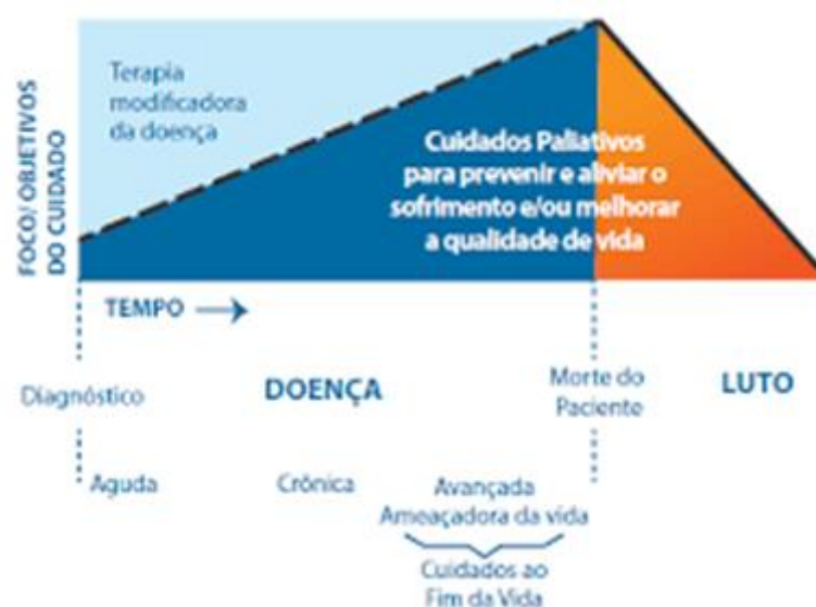
Figura 1 Modelo paralelo de Cuidados Paliativos.

“Cuidados paliativos são uma abordagem que melhora a qualidade de vida de pacientes, adultos e crianças, e suas famílias que enfrentam problemas associados a doenças limitadoras da vida. Previne e alivia o sofrimento através da identificação precoce, avaliação correta e tratamento da dor e outros problemas, sejam eles físicos, psicossociais e espirituais” (WHO, 2018).