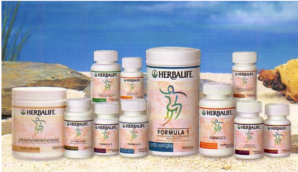
Figura 7 - Produtos da Herbalife