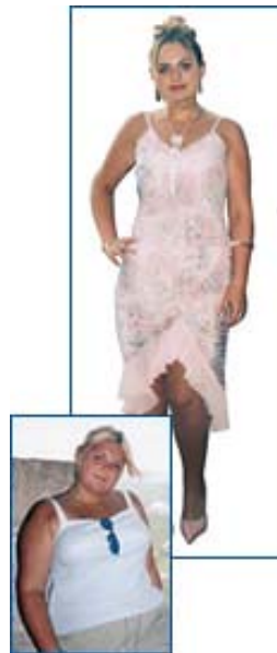
Figura 6– fotos ilustrativas de propagandas da Herbalife