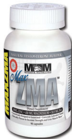
Figura 4- Produto MAX ZMA

Produtos para controle de peso corporal e alimentos para praticantes de atividade física, com muita frequência, apresentam em seus rótulos imagens de corpos delegados e homens musculosos, respectivamente, é o caso dos produtos vendidos pela Herbalife (figura 5- logotipo da Herbalife) e Gaytorate , como mostram nas figuras 6, 7 e 8 abaixo.