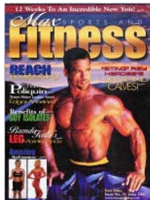
Figura 2- Revista Max Sport & Fitness