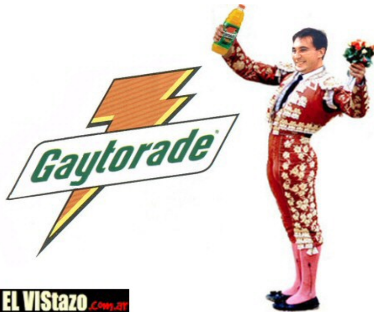
Figura 8 - Propaganda do produto Gaytorade